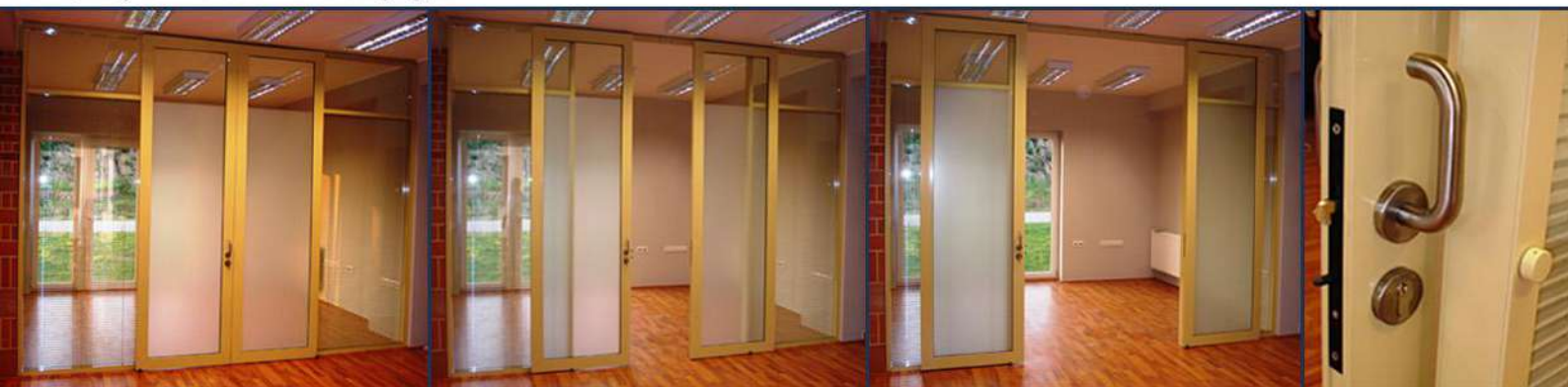
Baranya Téglakft. - Alsómocsoládi Téglagyár