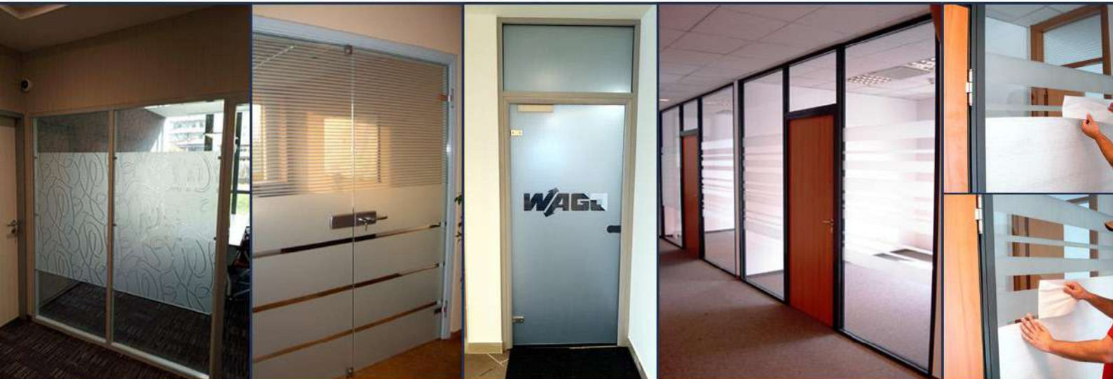
Stanley Black&Decker Hungary - Budapest