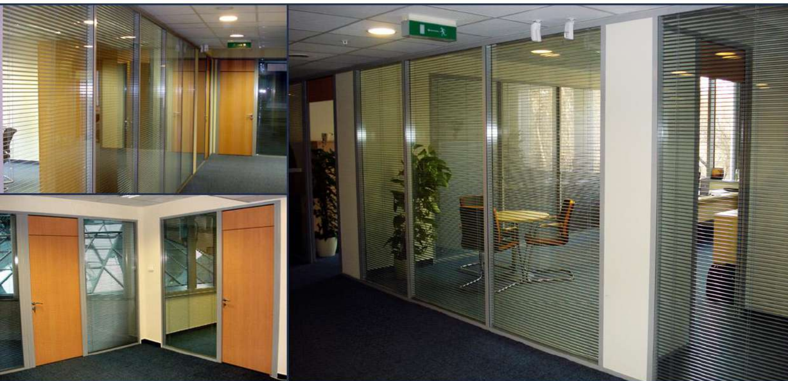
Bank Center - Budapest