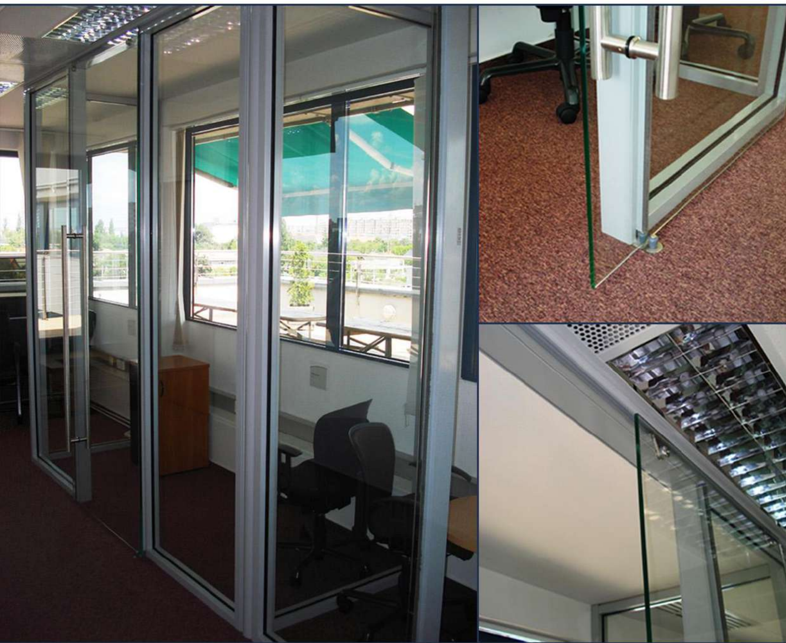
Borsodi Sörgyár Zrt. - Budapest