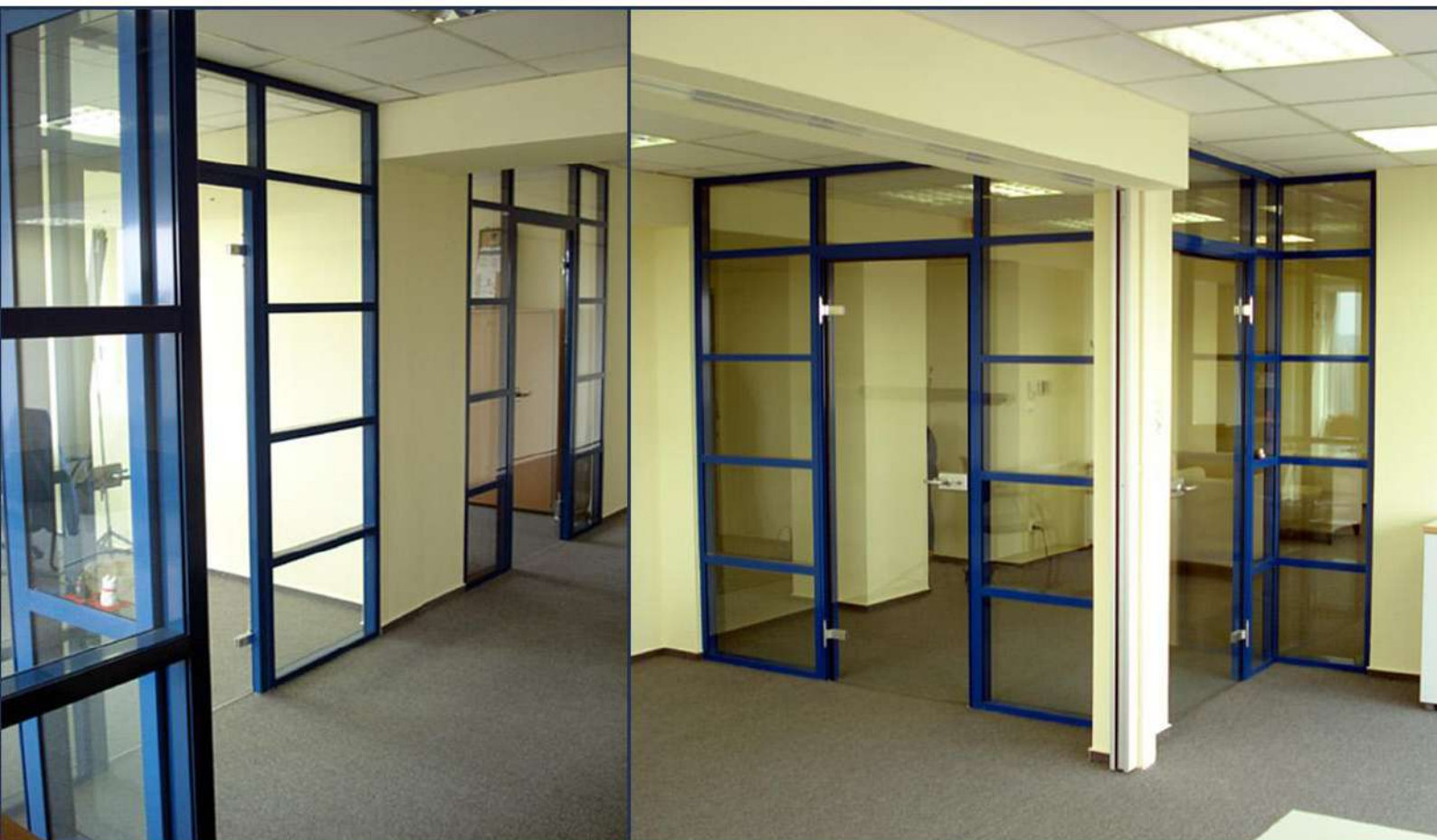
Life Technologies Magyarország Kft. - Budapest