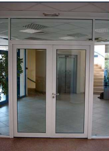
Magyar Nemzeti Bank - Budapest