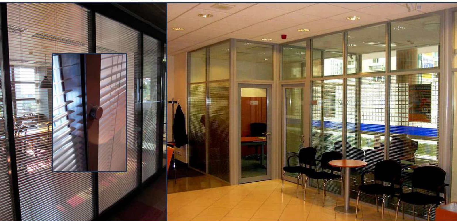
K&H Bank - Budapest